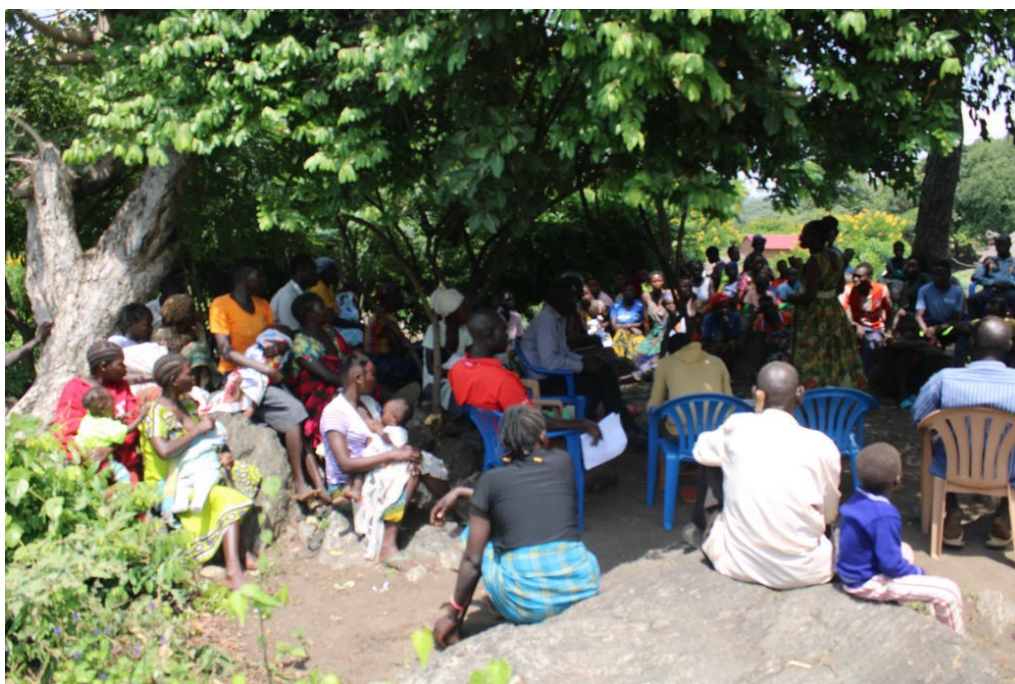
bijeenkomst inwoners Welle voor de Yearly Review

Het aantal ontvangers van dit basisinkomen is in 2025 gestegen van 380 naar 403. Maandelijks wordt het bewonersregister gecorrigeerd voor overledenen en degenen die uit Welle zijn verhuisd. Eénmaal per jaar tijdens de Yearly Review worden nieuwgeborenen en zo mogelijk ook degenen die in Welle zijn komen wonen, bijvoorbeeld door huwelijken, aan het register toegevoegd. Met de bewoners is in het community covenant afgesproken dat het totaal aantal ontvangers van de maandelijkse cash transfer per jaar met maximaal 3,6% mag stijgen. Dit percentage is gebaseerd op de gemiddelde bevolkingsgroei in Oeganda bij de start van het project.