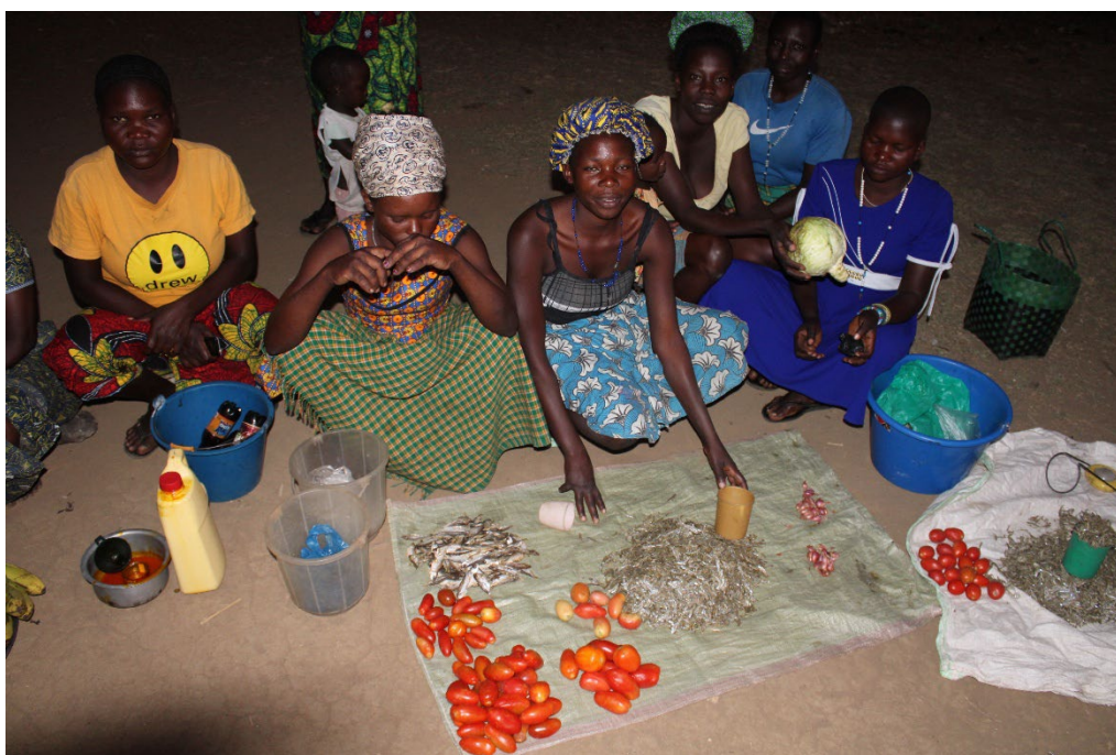
veel inwoners van Welle zijn een kleine handel begonnen

Het wetenschappelijk onderzoek is belangrijk om de voortgang van NIDP te volgen, maar ook als basis om bredere aandacht voor het project te vragen. INclusion is opgericht in de overtuiging dat direct geld geven beter werkt dan veel traditionele ontwikkelingsprojecten. Mensen die in armoede leven weten zelf het beste wat ze nodig hebben en ze zijn zeer gemotiveerd om hun eigen levensomstandigheden te verbeteren. Daarom zijn onvoorwaardelijke cash transfers effectief in het verminderen van armoede en alle problemen die daarmee samenhangen. Ook zijn de kantoor- en personeelskosten bij onvoorwaardelijke cash transfers veel lager dan bij andere projecten. Het wetenschappelijk onderzoek door de RUG, het onderzoek van AFARD en de monitoring rapporten van Atego Sub-county en Nebbi District bevestigen de effectiviteit van het project. Internationale onderzoeken naar andere cash transfer projecten laten hetzelfde beeld zien.