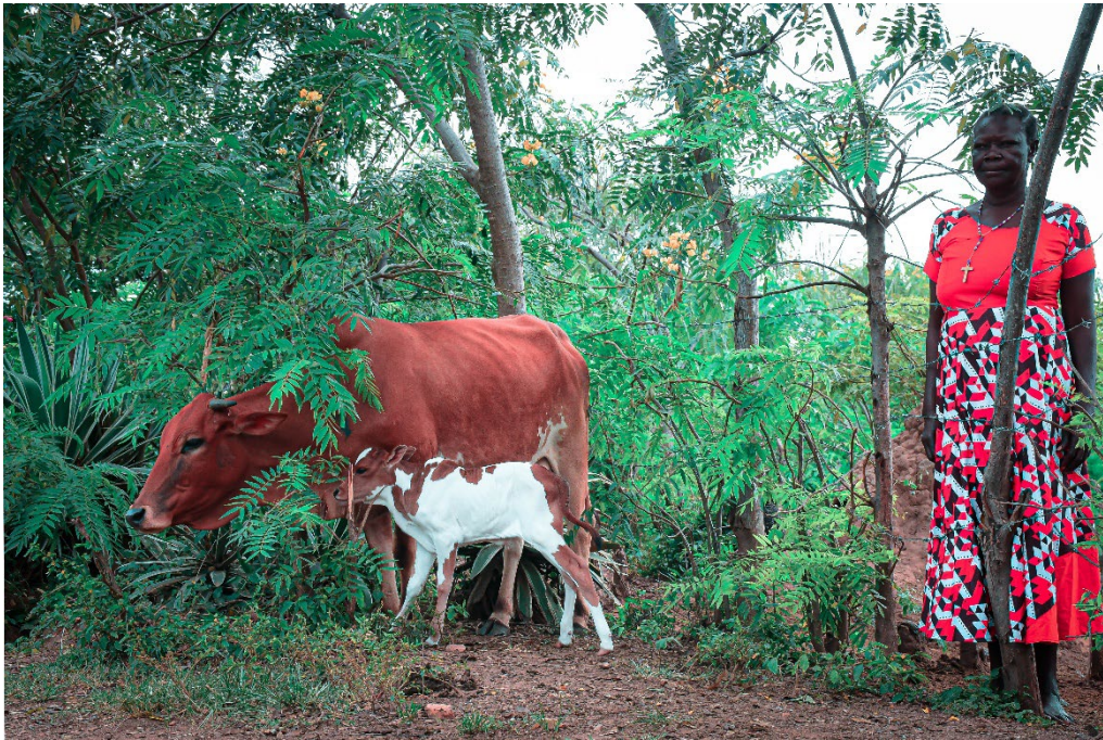
Ocima Elizabeth kocht koeien en verkoopt melk

De inkomsten uit landbouw en veeteelt zijn ook sterk gestegen: landbouw van 53 naar 112 euro per huishouden per oogstseizoen en veeteelt van 63 euro naar 276 euro per jaar. Deze sterke stijging komt door een combinatie van hogere productie en gestegen voedselprijzen.