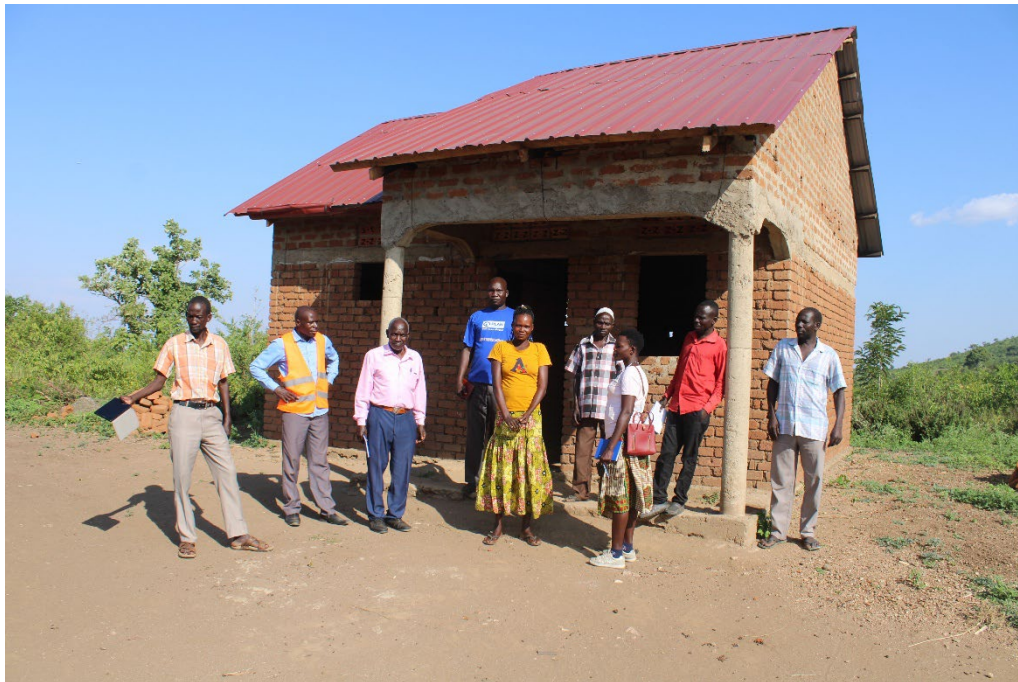
monitoring team bij een van de nieuwe huizen in Welle

The housing construction represents a critical step toward household stability and improved quality of life. Decent housing contributes to better health outcomes, security, and social standing within the community.