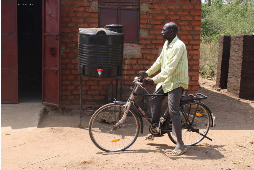
de inwoners van Welle investeerden ook in transportmiddelen

armoedebestrijding en ontwikkeling, en om ervoor te zorgen dat meer organisaties deze methode gaan inzetten.