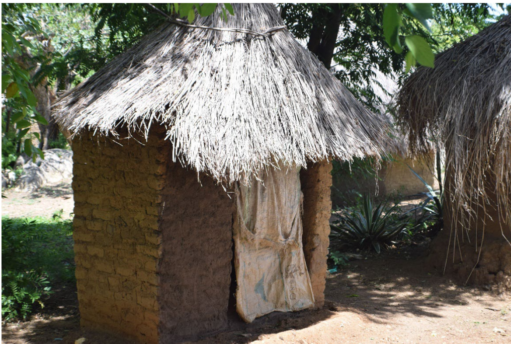
een van de nieuwe putlatrines in Welle

Het is natuurlijk aan ons om daar toch voor te zorgen. Er zijn ook interne redenen waarom de publiciteit in 2025 niet goed van de grond kwam. We hebben er minder in geïnvesteerd, omdat de prioriteit in het afgelopen jaar lag bij de fondsenwerving en een beperking van de uitgaven. Het was het allerbelangrijkste om de financiering van het project in Welle tot en met juli 2027 rond te krijgen. Uiteindelijk is dit gelukt. We zijn de organisaties en personen die ons steunen (zie paragraaf 1.8) hiervoor zeer dankbaar, mede namens de inwoners van Welle.