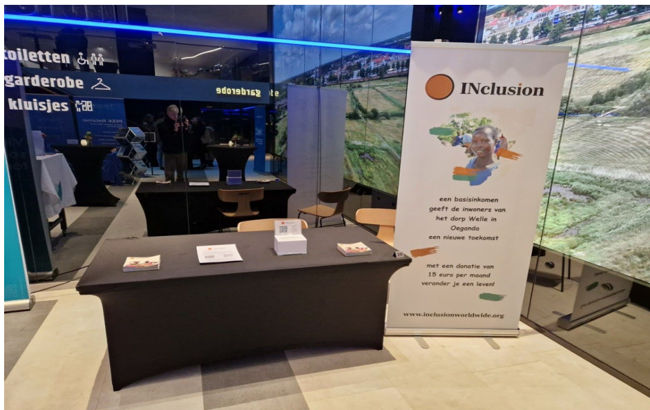
stand op het congres van de NVvO

Welle op een conferentie van de Nederlands Vereniging van Orthodontisten (NVvO). Als uitgekozen goed doel mochten we ons presenteren door middel van een stand en een lezing. Jammer genoeg heeft dit weinig opgeleverd. Het is niet duidelijk waarom, omdat de reacties op de presentatie positief waren. De meest waarschijnlijke reden is dat het moeilijker is om een algemeen publiek te bewegen tot donaties voor onze visie en aanpak - een basisinkomen als effectieve methode voor het verminderen van extreme armoede wereldwijd - dan voor single issue goede doelen. Als bijvoorbeeld donaties worden gevraagd voor een school of ziekenhuis, dan is voor de donateurs gemakkelijker invoelbaar wat er met hun donatie gebeurt. Het zal de komende jaren een uitdaging zijn om toch manieren te vinden om een breder publiek te bereiken.