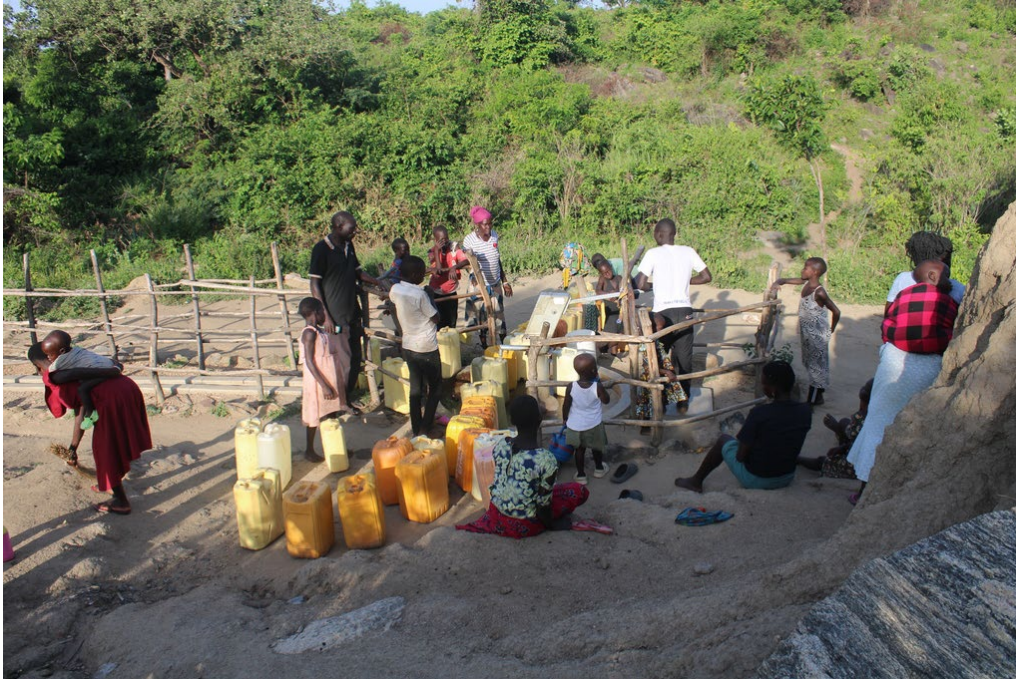
de tweede waterpomp in Welle

die het geld wilden gebruiken. Uiteindelijk zijn ook deze conflicten opgelost, mede door bemiddeling van het steering committee en AFARD.