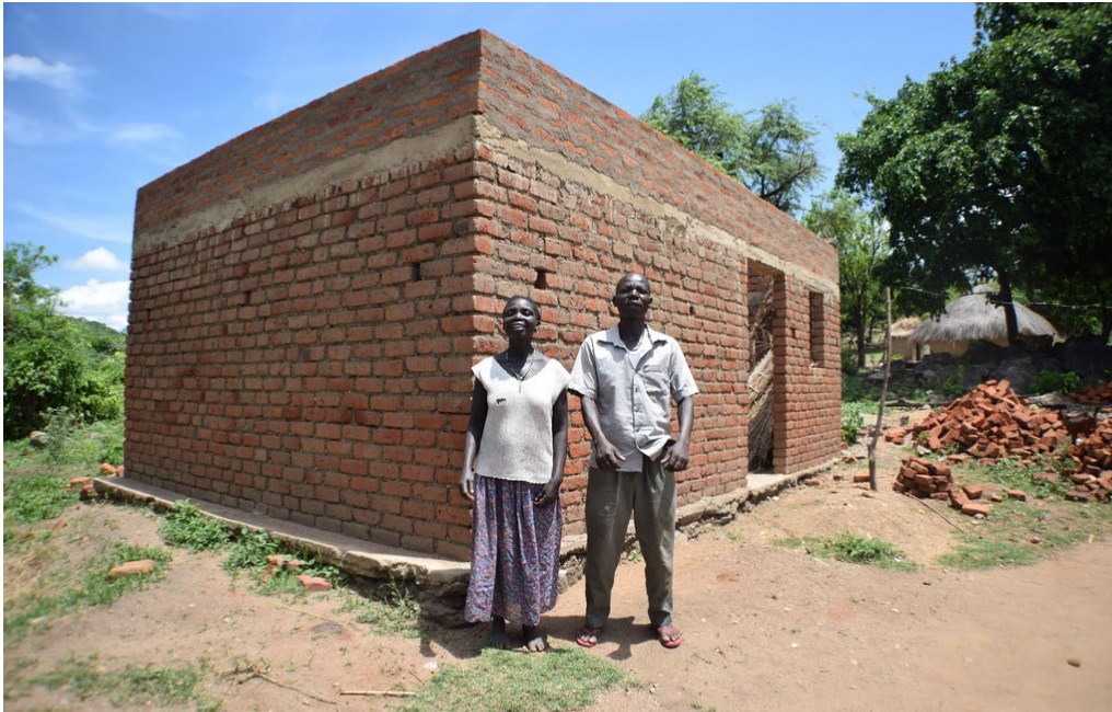
een van de nieuwe huizen in Welle in aanbouw

Ook op andere vlakken zijn er in 2025 verbeteringen te zien ten opzichte van het voorgaande jaar. Er is een zeer sterke toename in het bezit van duurzame, semi-permanente woningen, van 12% in 2024 tot 66% in 2025. Veel inwoners hebben de bouw van hun nieuwe woning in 2025 voltooid. De semi-permanente woningen van baksteen zijn sterker, comfortabeler en ruimer dan de traditionele woningen, en ze vergen minder onderhoud. Daarmee leveren ze een belangrijke bijdrage aan het verbeteren van de levensomstandigheden van de mensen in Welle.