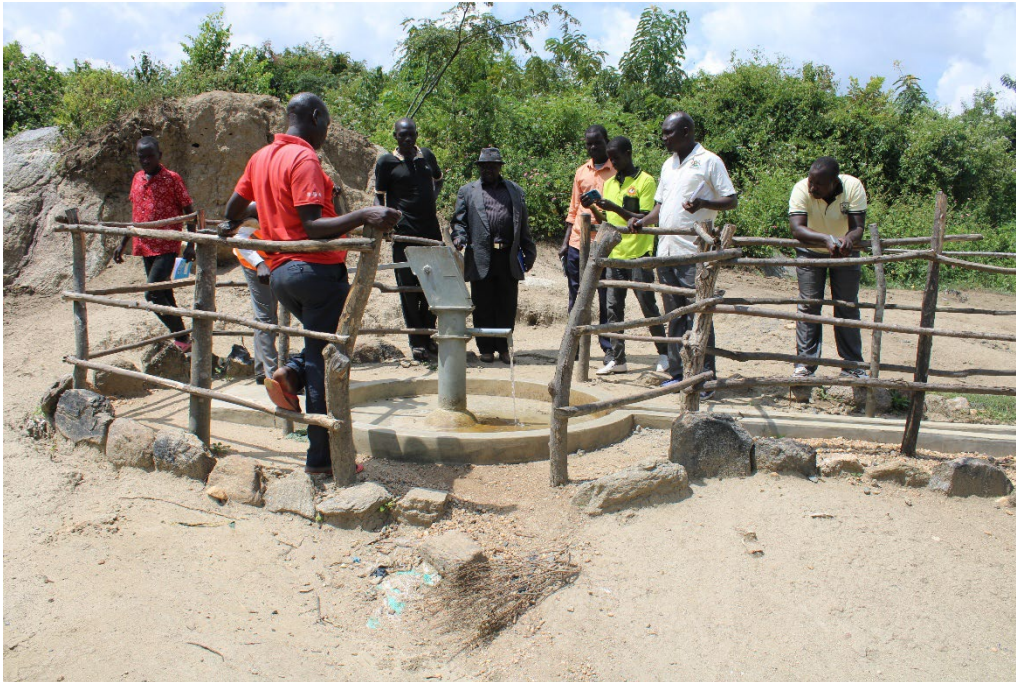
monitoring team bekijkt een van de twee waterputten in Welle

hadden gebouwd of daarmee bezig waren. Verder investeerden de meeste dorpsbewoners in vee en landbouw. Ook hadden de meeste bezochte huishoudens bomen geplant.