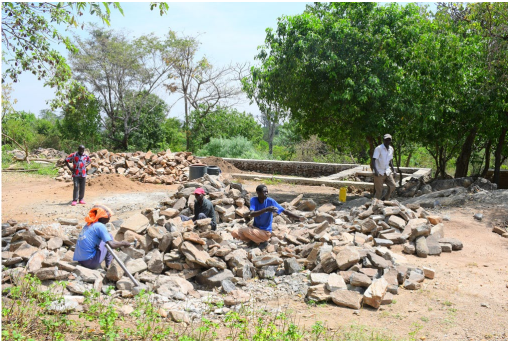
de kerk in aanbouw

In 2025 is op verzoek van de inwoners UGX 40.220.856 (zo'n 9.575 euro) overgemaakt uit het community fund , dat wordt beheerd door INclusion, om te investeren in de bouw van een kerk. Deze kan ook worden gebruikt voor andere gemeenschappelijke bijeenkomsten in het dorp dan kerkdiensten.